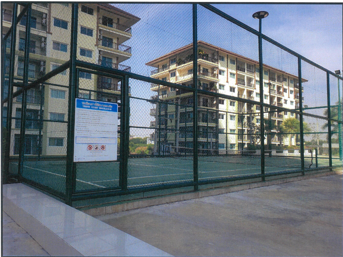
บันทึกภาพ : ธันวาคม 2565